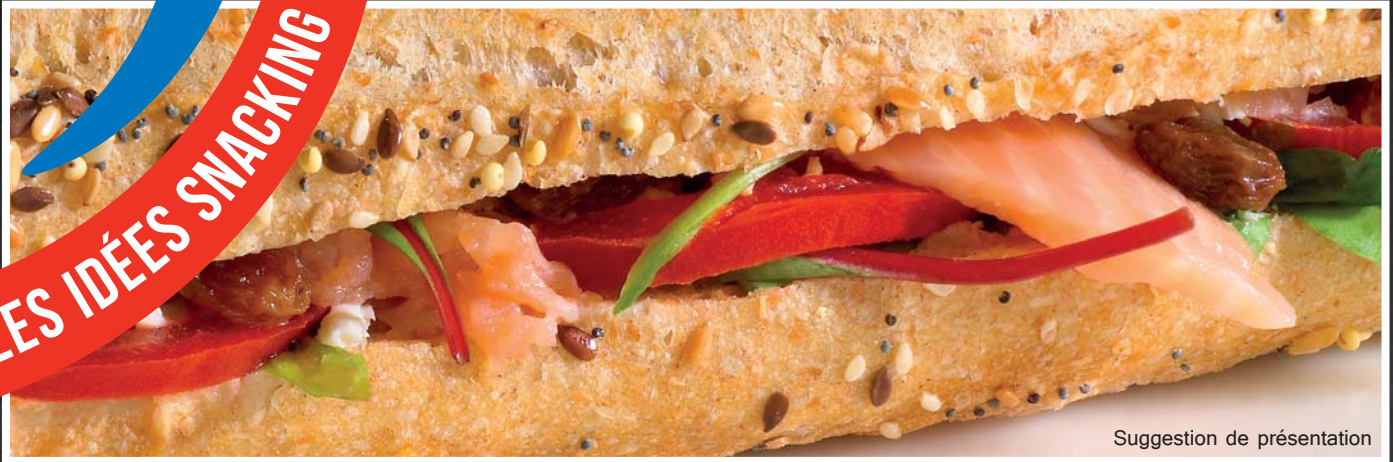
Suggestion de présentation